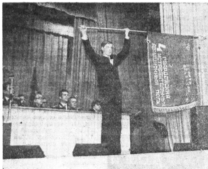
Вынос фронтового боевого знамени на военно-патриотическом вечере в институте.

ПОИСК ЭФФЕКТИВНЫХ и комплексных методов интенсификации экономического развития привел в последние годы к возникновению эргономики — нового направления в науке. Это было закономерным результатом развития современного производства, которое ныне широко оснащается сложными техническими средствами и системами.