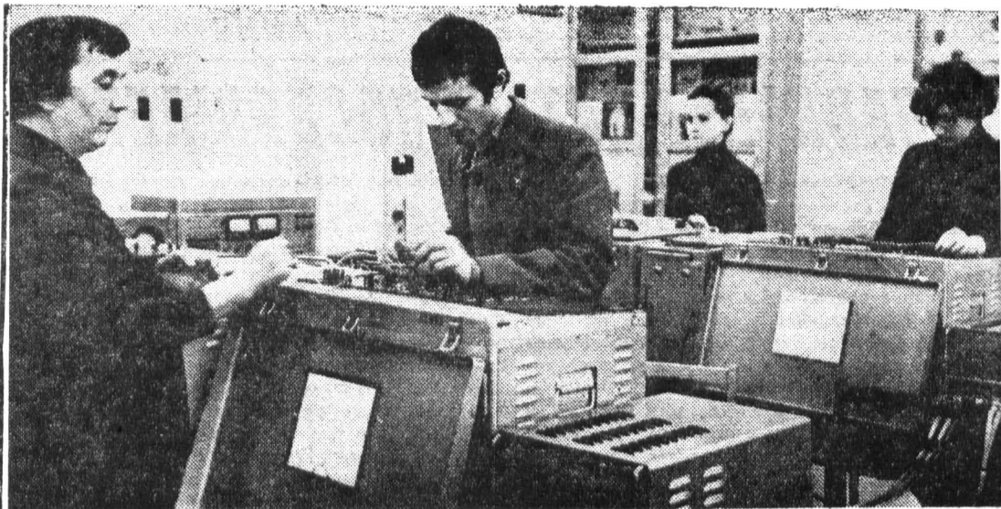
Старшекурсники на практических занятиях в лаборатории аналоговых вычислительных машин.

Поле, где надлежит реализовывать трассы, разбивается на квадраты, носящие названия дискретов, сторона которых равна