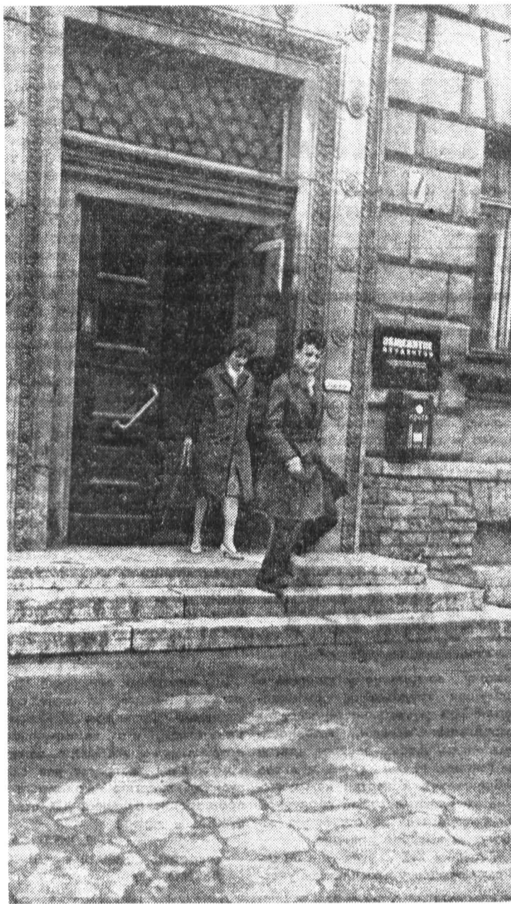
В ранний утренний час на Вяземском.

Мы и сами идем навстречу этой заинтересованности, проводя беседы по темам: «Человек, мораль и закон», «Преступность молодежи в крупных городах», «Правовые и социально-психологические аспекты семьи и брака».