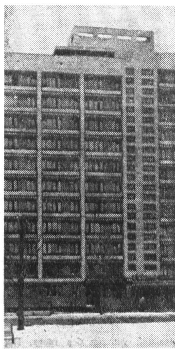
Здание в студгородке на Новоизмайловском, где расположено общежитие оптического факультета.