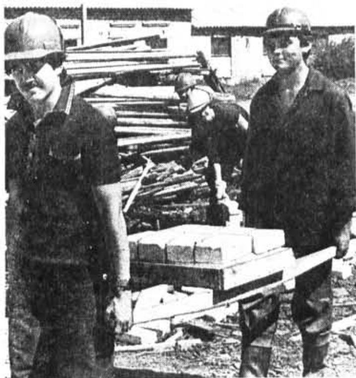
Из фотолетописи ССО-81. Бойцы отряда «Одиссей» на строительных работах в совхозе «Верево».

ВПЕРВЫЕ среди известных, привычных названий студенческих отрядов ЛИТМО зазвучало в этом году: «Одиссей». Имя отряда включает в себя, как мы полагаем, и трудности жизни на стройке, и стремление достичь