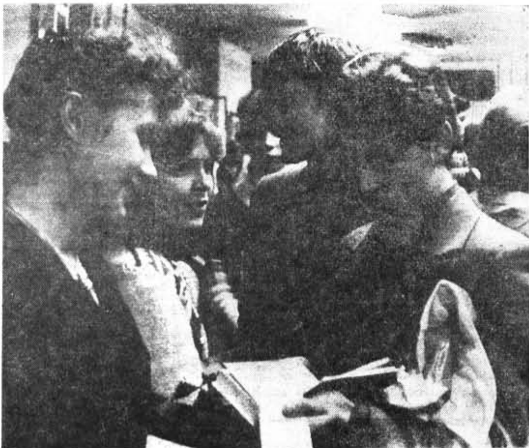
На институтском слете ССО. Сегодня и не подумаешь, что летом эти юноши и девушки в строительных робах и касках, запорошенные цементом, вели кирпичную кладку, забивали сваи, штукатурили стены...

В. ПАВЕНКОВ, доцент кафедры истории КПСС, заместитель руководителя секции ФОПа