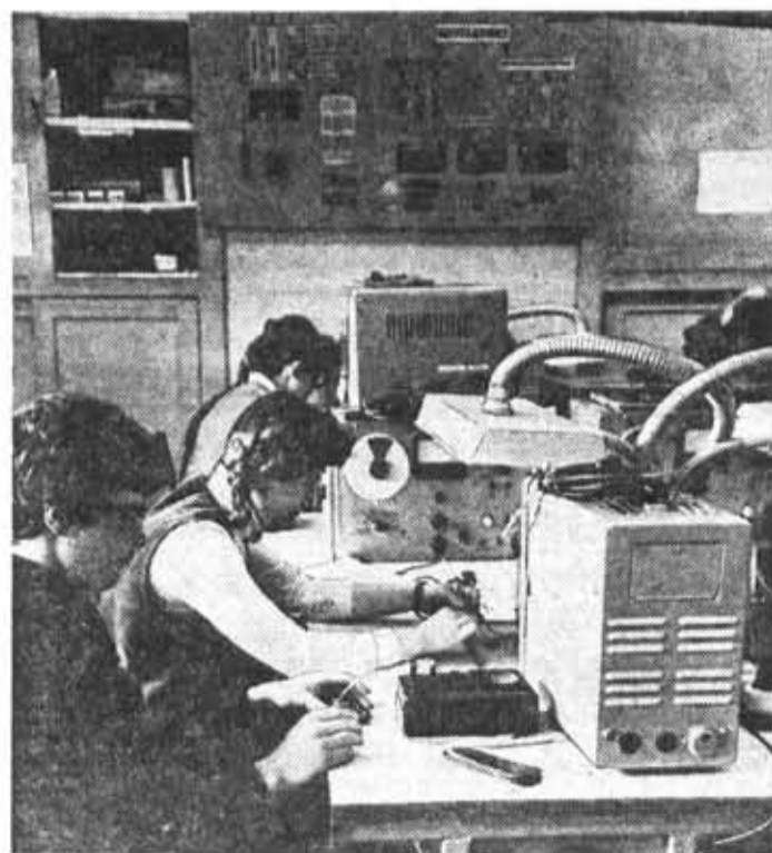
Практические занятия в учебных мастерских кафедры.