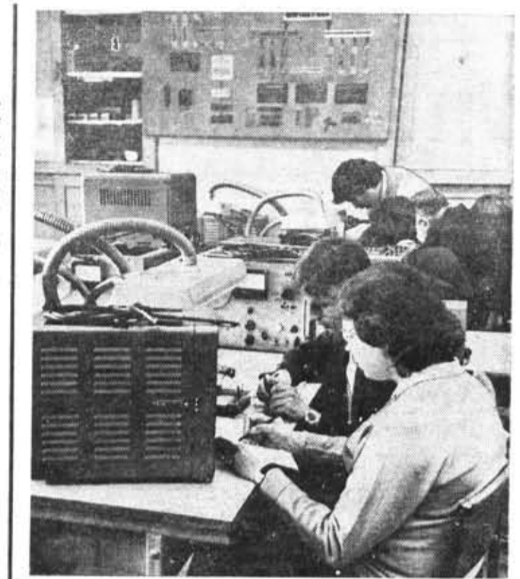
Первокурсники за работой на электромонтажном участке мастерских кафедры технологии приборостроения.

Вообще, когда речь заходит об этом методе, в объединении на-