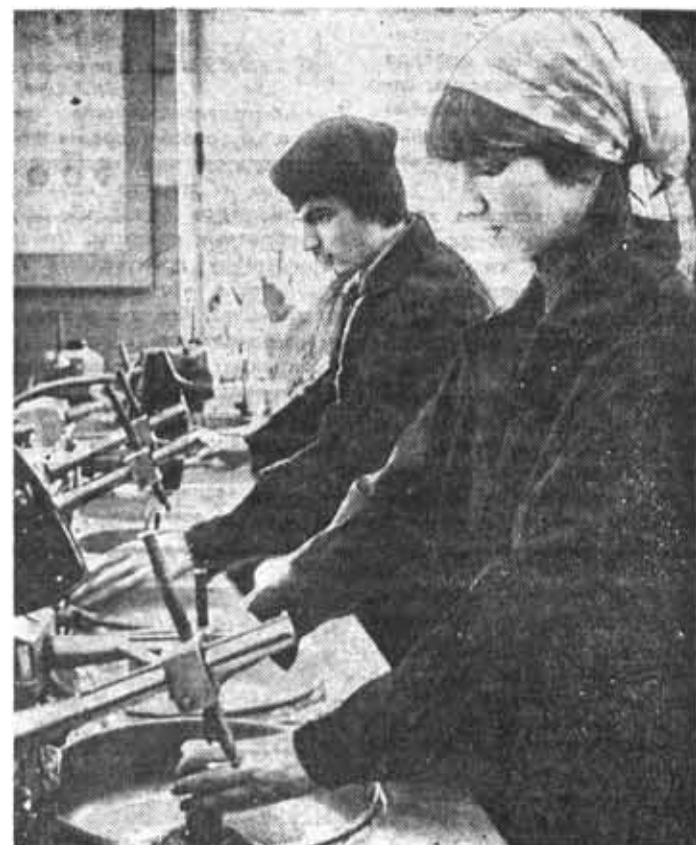
Обладение простейшими технологическими операциями на оптическом участке учебных мастерских.

Итак, аспекты «значимости» и «уважения» к технологии являются основой того, что должно, если не увлечь, то заинтересовать студентов, в возможно, и привлечь их к технологии, как к будущей области инженерной деятельности.