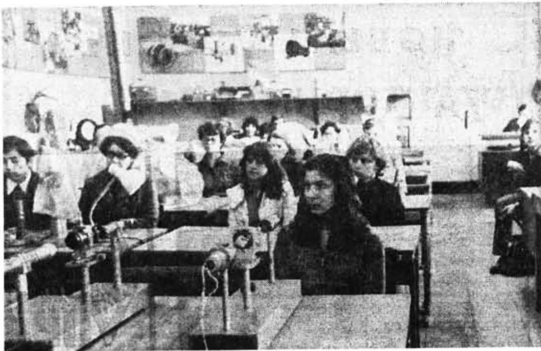
День открытых дверей на кафедре конструирования и производства оптических приборов.