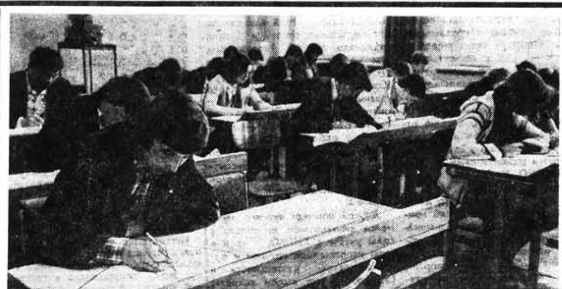
На вступительных экзаменах.

В конце первого семестра, перед экзаменационной сессией, для первокурсников в общении проводятся вечера вопросов и ответов по адаптации к условиям вузовской жизни с привлечением студентов старших курсов. На этих встречах обсуждаются трудности, возникающие перед студентами на первом кур-