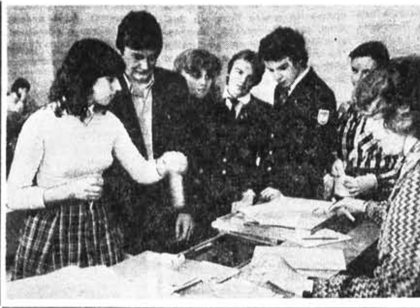
На вступительных экзаменах по математике.

На первом курсе вовлечению студентов в исследовательскую работу может помешать процесс адаптации, связанный с изменением, ломкой ранее сформировавшегося жизненного стереотипа. У некоторых студентов этот процесс протекает весьма тяжело и длительно, вызывает затруднения в учебе и общественной деятельности. В конечном счете это тоже этап своеобразного творческого