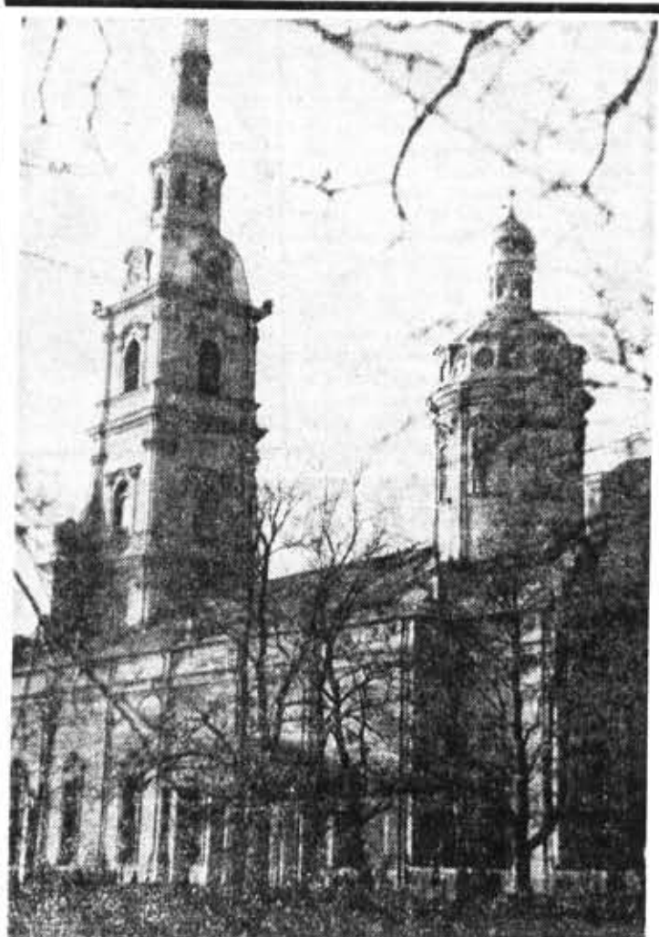
Нижний город. Петропавловский собор.

ДЕ ГРООТ С. Р., САТТОРН Л. Г. Заключительная. Часть 2. М. Наука, 1982. 200 с.