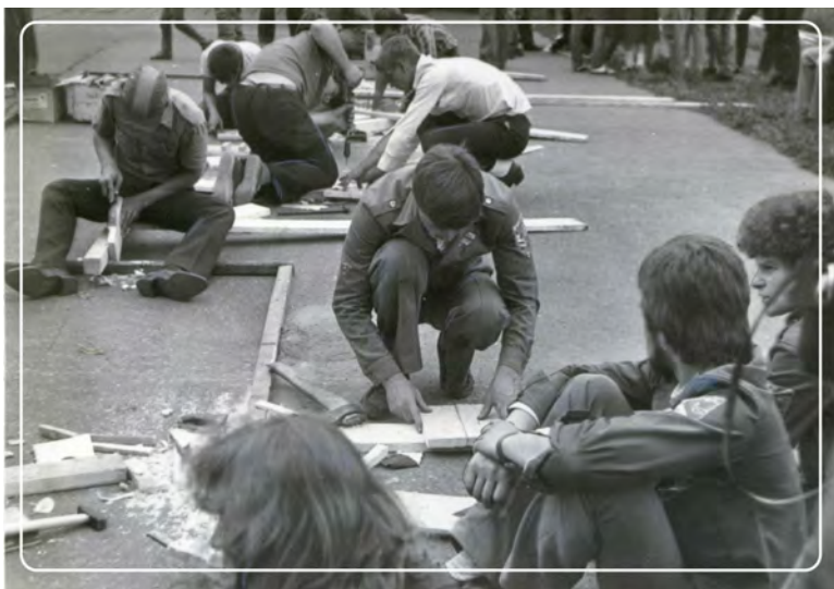
Конкурс плотников на фестивале ССО, на фотографии бойцы отряда «Славяне»