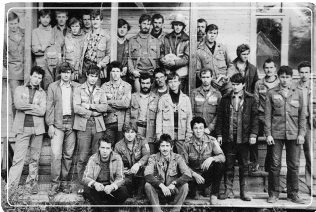
Фотография на память: бойцы ССО «Юстус». Гатчинский район

Проходил у нас еще и фестиваль. На стадионе «Спартак» были организованы шуточная эстафета, заплыв на катамаранах, конкурс рисунков на асфальте, выступления агитколлективов.