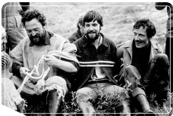
Праздник посвящения в бойцы ССО «Петроградский»: руководство отряда «повязали салаги»