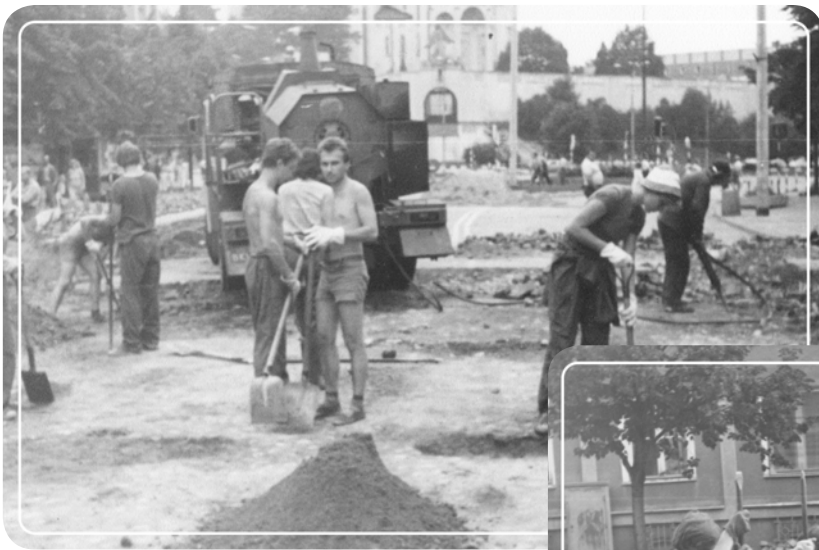
Бойцы отряда за работой. Варшава