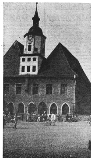
По маршрутам путешествий интертрада. Регенсбург в городе Иене.