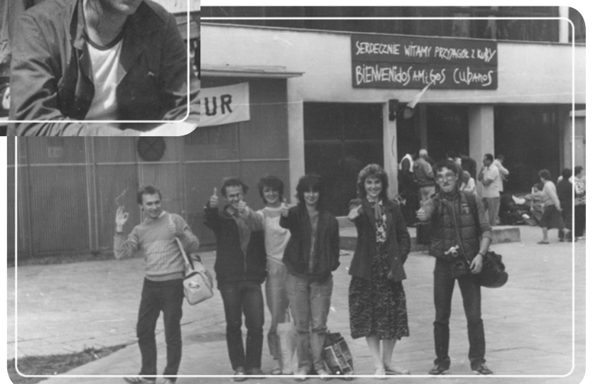
Бойцы отряда около студенческого общежития