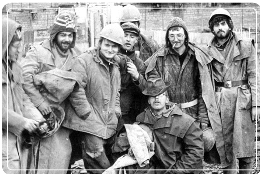
«На свободу – с чистой совестью». ССО «Петроградский». Якутия, пос. Депутатский