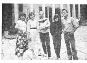
Советские студенты возле областного музея. Фирмы «Нард» Цейс. Фотографировал бойца фотона.