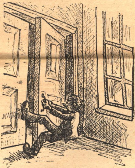
Рис. Н. В. Задесенцева

Что изображено на этом рисунке? — На нем изображен молодой человек, по-видимому, один из наших студентов.