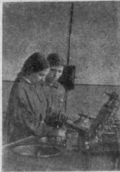
Лучшие ударники оптич. цеха школы-завода