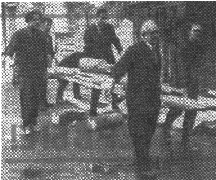
Сотрудники кафедр радиотехники и спектральных и оптико-физических приборов на коммунистическом субботнике.

Нынешний субботник был знаменателен по-особому. Все мы живем под впечатлением события выдающегося исторического значения — XXIV съезда КПСС. Самоотверженным ударным трудом на субботнике отвечали со-