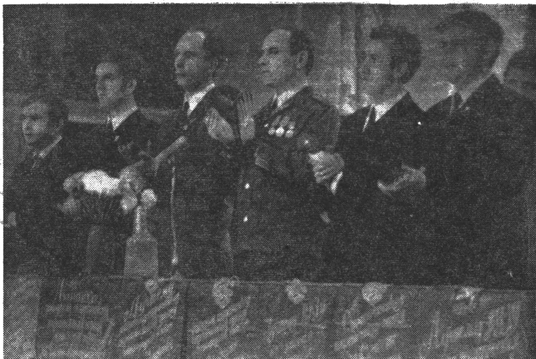
В президиуме четвертого общественностного съезда ССО. Репортаж о съезде читайте на третьей странице.