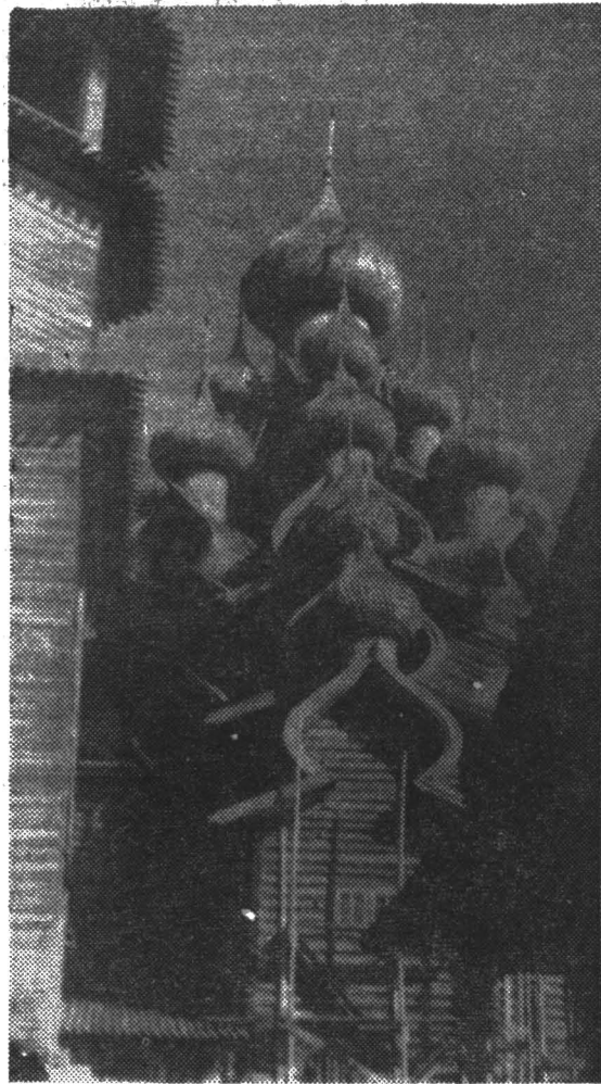
ПО МАРШРУТАМ СТУДЕНЧЕСКИХ ПУТЕШЕСТВИЙ. КИЖИ.

«Я благодарен И. И. Иванову за помощь в экспериментах и П. П. Петрову за ценное обсуждение». (Иванов получил все результаты, а Петров объяснил, что они зна- чат).