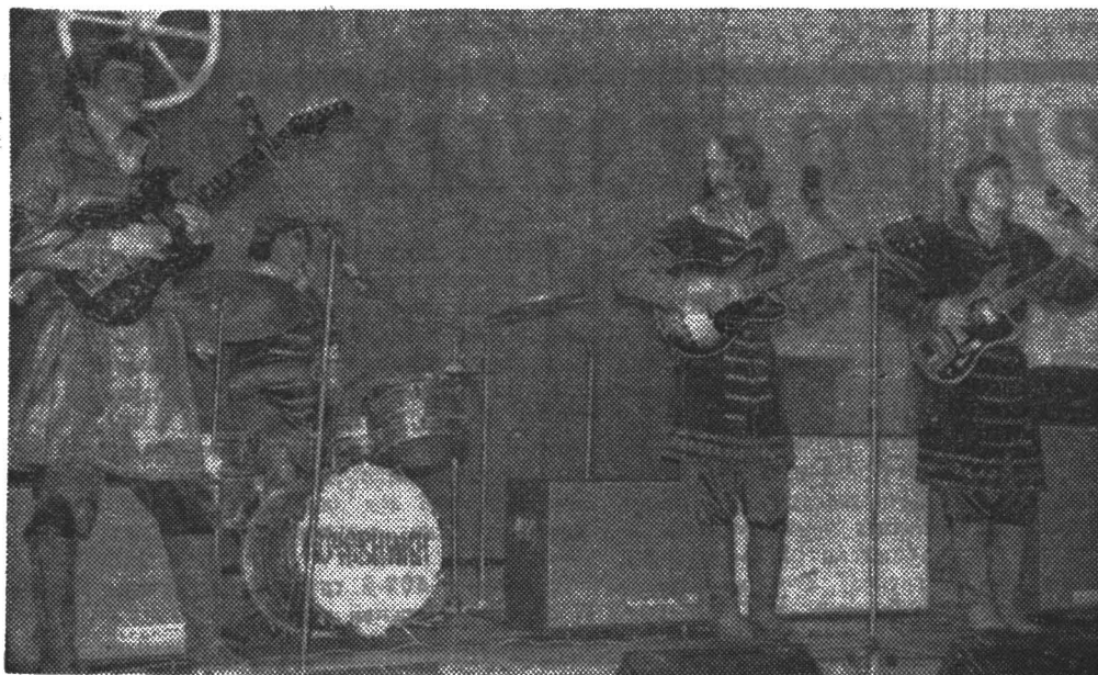
«НОЧЕВНИК» НА ВЫСТУПЛЕНИЕ АНСАМБЛЯ СЛЕТЕ ОТЛИЧНИКОВ ЛИТМО.

М-20552 Заказ № 8378 Ордена Трудового Красного Знамени типография им Володарского Лениздата, Ленинград, Фонтанка, 57.