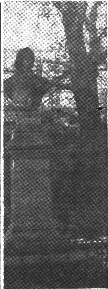
У памятника Петру I на Петроградской стороне.