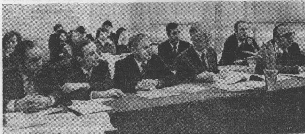
Заседание Государственной экзаменационной комиссии по специальности «Конструирование и производство электронно-вычислительной аппаратуры». Студент 626-й