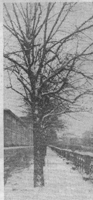
Весной на Мойке.