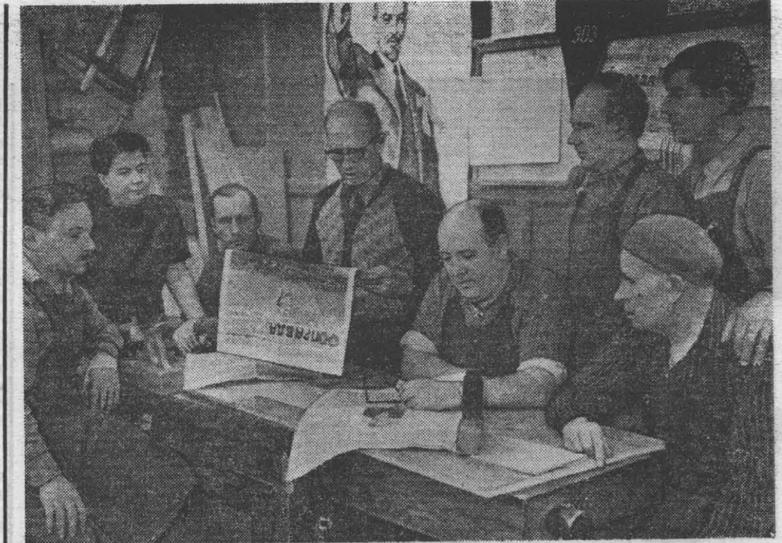
Из фотолетописи института. Обсуждение материалов партийного съезда на столорном участке экспериментально-опытного завода.

— И на чем Вы остановились? — Записалась в научно-техни-