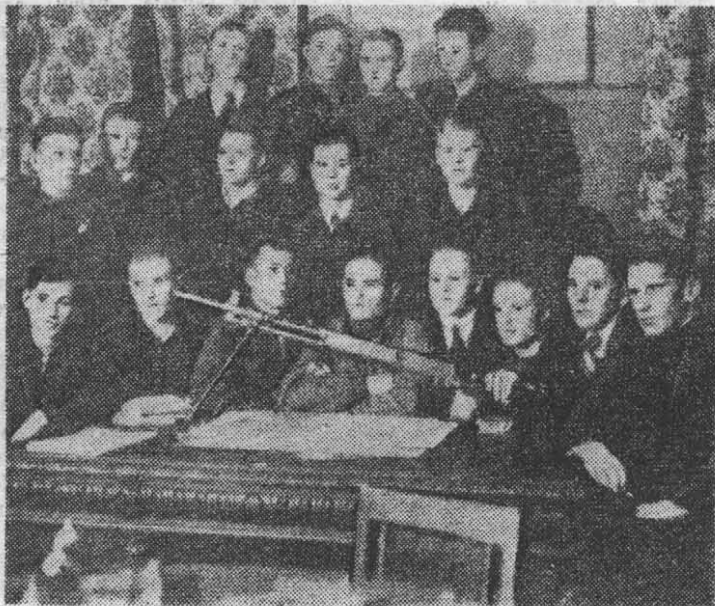
Из фотолетописи ЛИТМО. Занятия в кружке Осоавиахима.

В ответ на заботу родной партии и Советского правительства комсомольцы института стремятся глубоко и творчески овладеть знаниями. 55 процентов студентов учатся на «хорошо» и «отлично». За последние два года число групп со 100-процент-