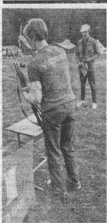
Военно-патриотический слет в районном студенческом строительном отряде «Гатчинский».

В ИНСТИТУТЕ прошел месячник оборонно-массовой и военно-патриотической работы, посвященный XXVI съезду КПСС и 63-й годовщине Советской Армии и Военно-Морского Флота.