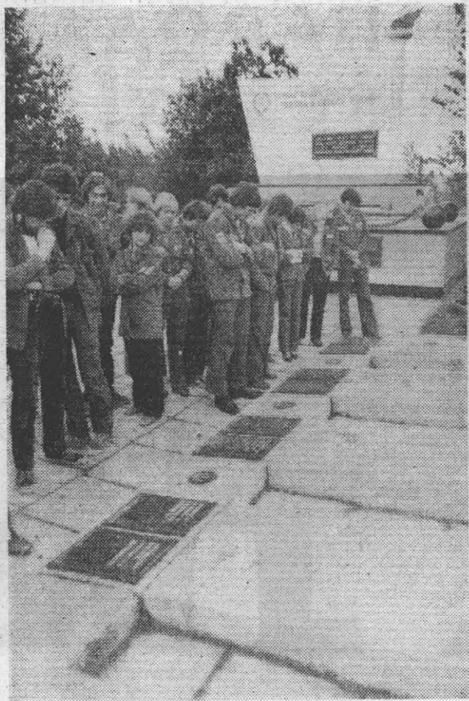
Поход по местам боевой и революционной славы советского народа. Бойцы ССО «Импульс» у памятника ополченцам-добровольцам Балтийского флота.