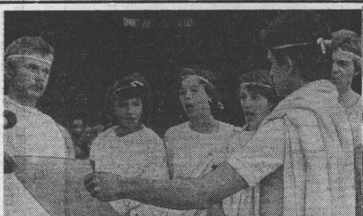
Студенты любят театр. И очень часто на стройках, во время уборки урожая, на слетах они придают самым обычным, рядовым церемониям характер театрализованных зрелищ.

ПОРОЙ КОМСОМОЛЬСКИЕ вожаки пытаются в короткий