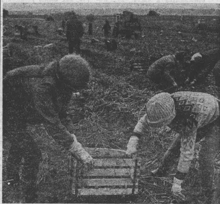
На полях совхоза «Гатчинский» проведен конкурс профессионального мастерства. Рекордным оказался результат команды подборщиков картофеля из двух человек, заполнивших клубнями за 1 час 22 минуты 76 ящиков.