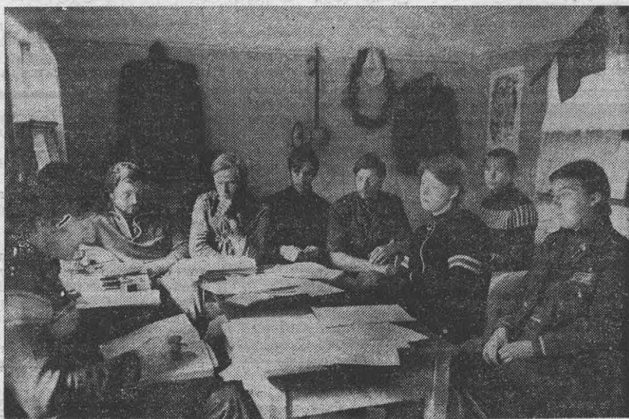
ЗАСЕДАНИЕ ШТАБА ССО «ВИТЯЗЬ», УЧАСТВОВАВШЕГО В СТРОИТЕЛЬСТВЕ СПОРТЛАГЕРЯ ЛИТМО.

Одна беда в нашем спортлагере: что он был палаточным, слишком уж сезонным. А места здесь такие, что грех сюда не приехать зимой, да и поздней осенью здесь раздолье и для спортивных тренировок, и для воскресных за-