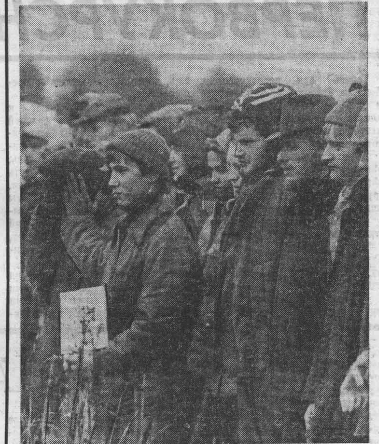
На полях области. День ударного труда в районном СХО «Гатчинский» (верхний снимок). В конкурсе профессионального мастерства отличился отряд ЛИТМО «Нива» (снимок внизу).

более тонн в день. Это много. Были дни, когда мы задерживались после окончания работы на час и на два, причем под проливным дождем; нередко работали без обеда или обедали прямо на поле.