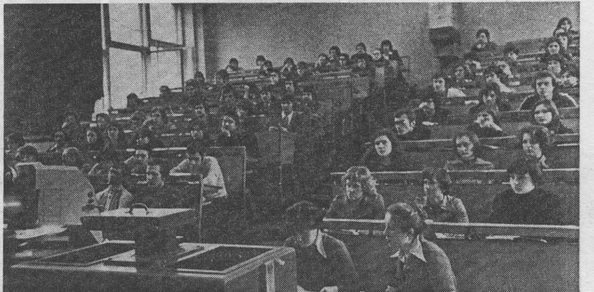
(снимок слева). Заседание секции физики на студенческой научно-технической конференции, в котором актив-