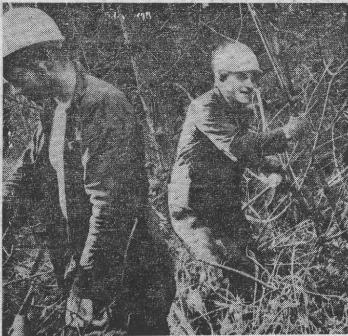
Из фотолетописи ССО-81. Интернациональный ССО «Товарищ» в ГДР. Студенты ЛИТМО на расчистке леса.

шеством организации оказали нам преподаватели и сотрудники кафедр общественных наук. Планируется также создание ряда лекториев в институтских общежитиях. Большие требования предъявляются сегодня к художественной самодельности. Коллективы, работающие непосредственно при клубе, должны стать методическими центрами для всей студенческой факультетской самодельности. Больше внимания следует уделять репертуарной политике коллективов, их творческой отдаче, росту уровня исполнительского