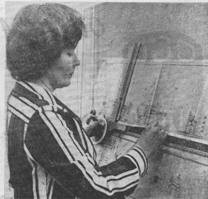
НАША ДОСКА ПОЧЕТА