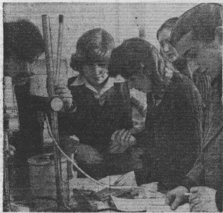
Учебные будни. Лабораторная работа на кафедре химии.

Сложилась эффективная форма участия комсомола института в формировании марксистско-ленинского мировоззрения, морально-политических и организаторских качеств. Огромную роль играют здесь кафедры общественных наук. Закономерен результат совместной работы КОИ и комсомола — заметный рост интереса студенчества к социально-политическим дисциплинам, к произведениям классиков марксизма-ленинизма, повышение уровня успеваемости и качества знаний. Не-