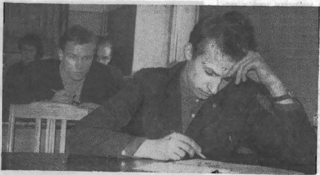
Сдаёт 267-я... Математика. Есть над чем задуматься!

С ЦЕЛЮ дальнейшее повышения уровня работы студенческих научных обществ, обобщения опыта их деятельности в течение 1965 года проводился смотр научно-исследовательской работы студентов Ленинграда. Городскому смотру предшествовали институтские смотры, которые показали, что ректораты, деканаты и общественные организации вузов стали уделять больше внимания вопросам руководства студенческой научно-технической работой в кружках при кафедрах, в проблемных и отраслевых лабораториях, в студенческих конструкторских бюро.