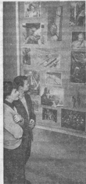
Фотостенд хорош, пока не устарел!

Намечен твердый график проведения обходов по общежитию для оценки дежурства по этажу. Теперь обход будет производиться дважды: с 18 до 19 часов и с 23 до 24 часов.