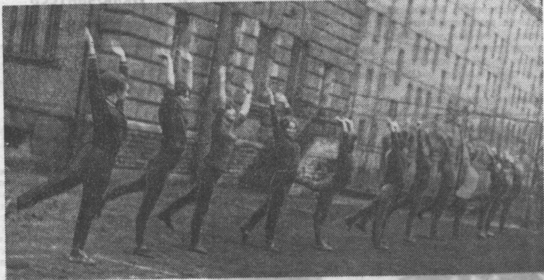
Ты не бойся ни жары и ни холода!