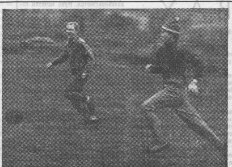
Есть в общежитии и свои Эйсебио!

М-54236 Заказ № 1472 Типография им. Володарского Лениздата, Ленинград, Фонтанка, 57