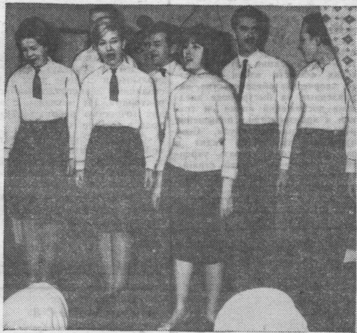
Приветственным песнопением начинает свое выступление агитбригада литмонатов. Такое традиционное вступление настраивает зрителей и слушателей на шуточный, непринужденный лад. А это очень важно для успеха концерта.