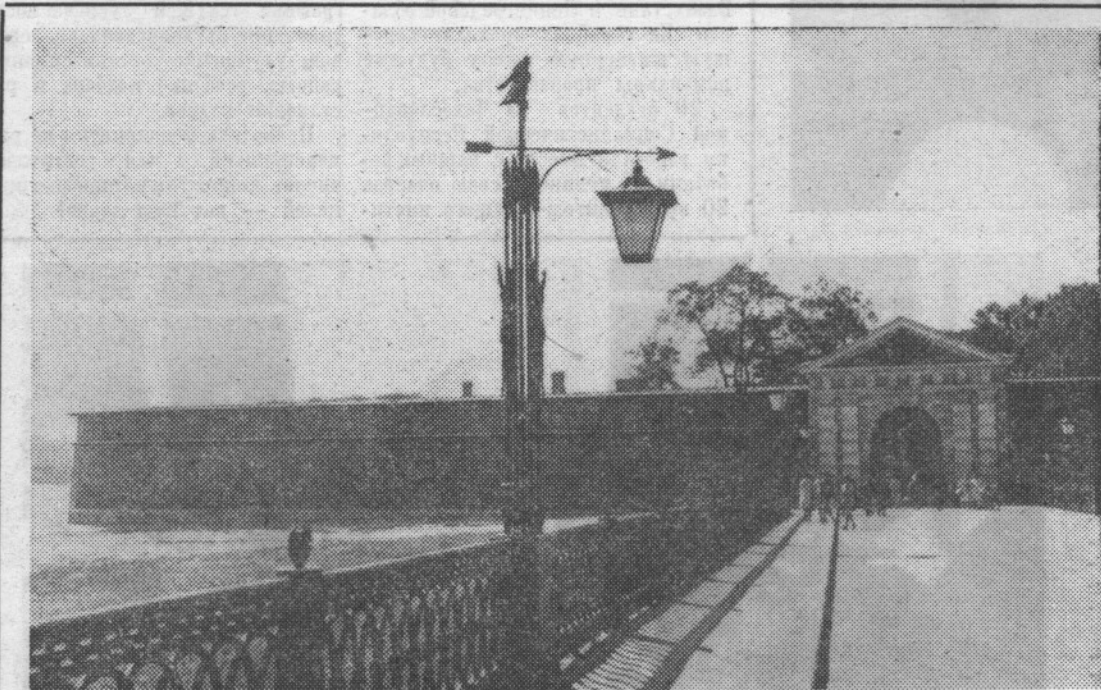
Наш город. Троицкие ворота Петропавловской крепости.