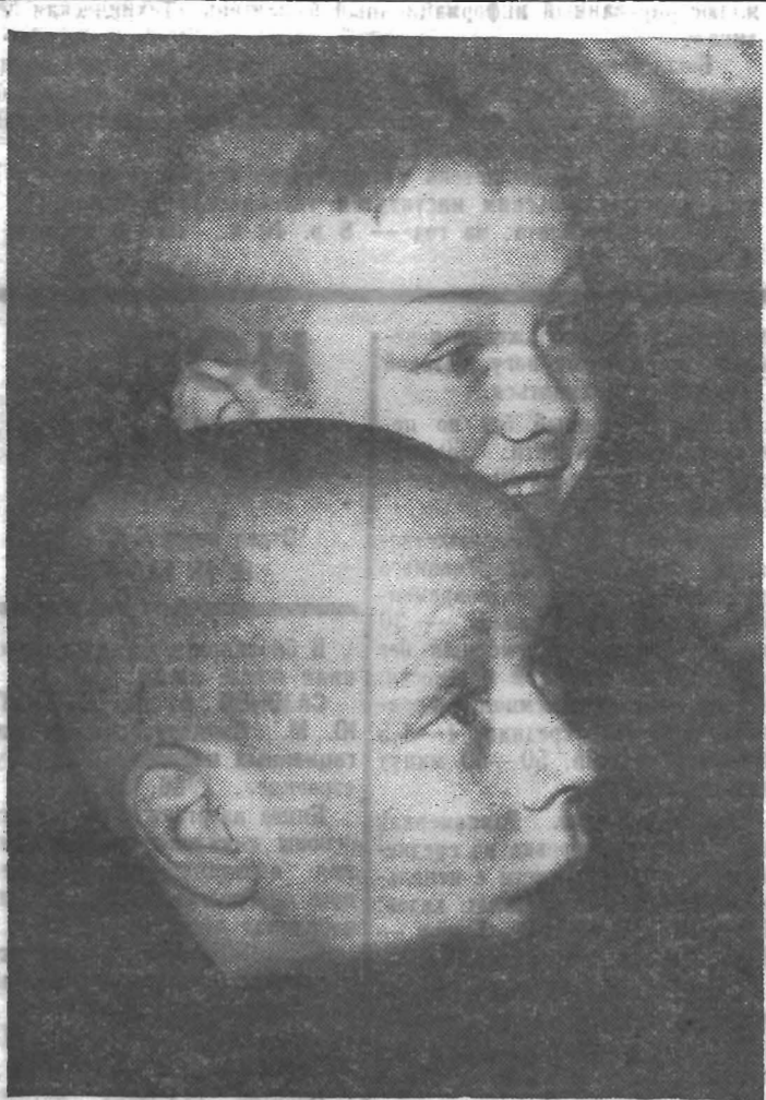
Из цикла: «С агит-бригадами по области». Студенты приехали! Фотоэподе Бориса Зотова (314-я группа).