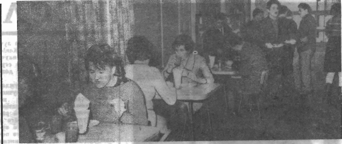
Буфет в общежитии рабо- тает с полной нагрузкой, осо- бенно в часы «пик». Конечно, хорошо, что здесь, у себя до- ма, можно перекусить, выпить стакан горячего чая. Но сту- денты все же мечтают о боль- шем — о стационарной, хоро- шо оборудованной столовой...

Ничто не может соперничать с телефоном как средством эконо- мии времени, когда надо полу- чить какие-то данные, сделать заказ, выяснить недоразумение,