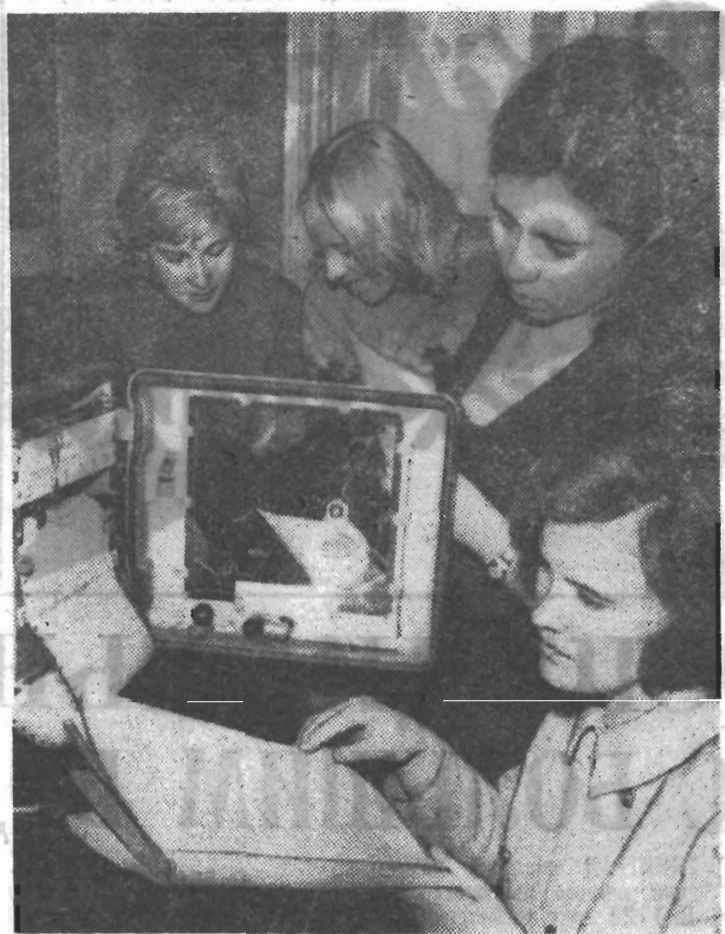
Лабораторные работы повышенной сложности выполняют студенты на кафедре автоматизации и телемеханики. Многие из этих работ являются своего рода небольшими научными исследованиями.

Молодых специалистов, окончивших радиотехнический факультет, ждет увлекательная, творческая работа в области новой техники.