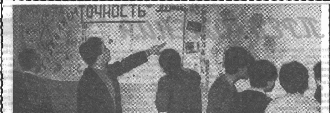
Появление стенной газеты — долгожданное событие. Волею свеклого номера всегда многолюдно. Только жаль, что стенгазеты появляются не так часто, как этого бы хотелось...

10 АПРЕЛЯ в 20 часов в зале «Романтик» выступят с концертом студенты Ленинградской государственной консерватории имени Н. А. Римского-Корсакова.