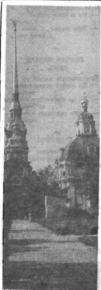
Наш город. Петропавловский собор.