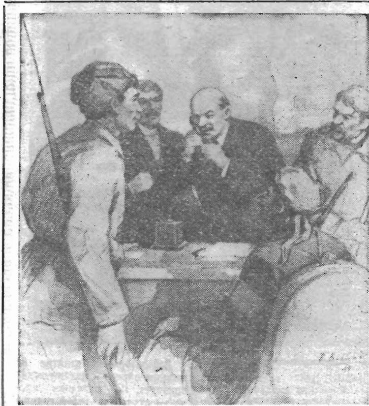
В. И. Ленин у телефона в Смольном.