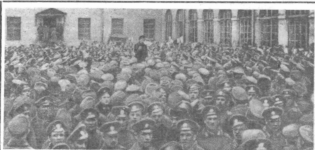
Митинг революционных солдат в октябре 1917 года.