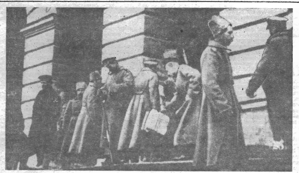
Октябрьские дни. У подъезда Смольного.

(Из Тезисов ЦК КПСС «50 лет Великой Октябрьской социалистической революции»).