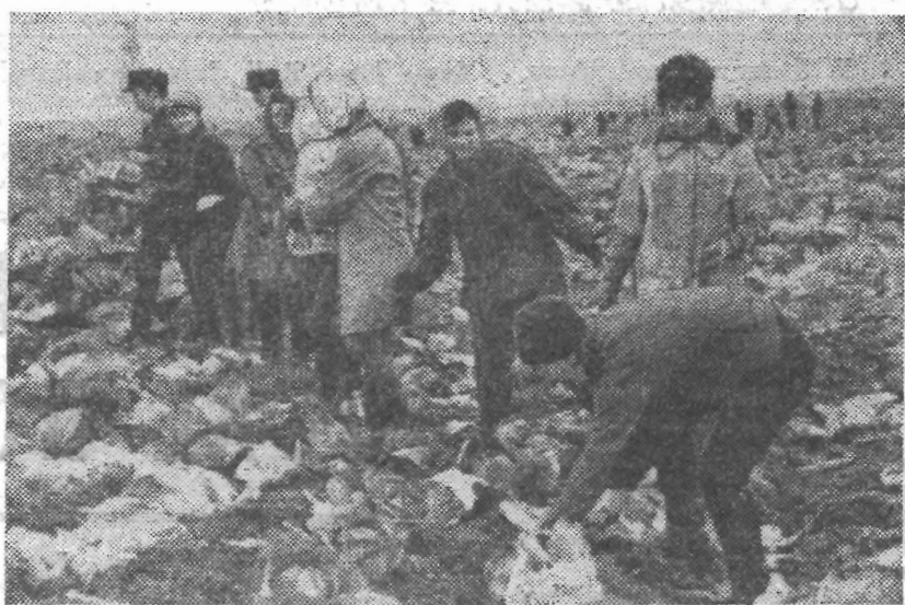
Сентябрьский воскресник. Студенты-литмонавты собирают капусту, помогая одному из пригородных колхозов.

Редакция газеты «Кадры приборостроения» обращается ко всем сотрудникам и выпускникам ЛИТМО с просьбой присылать материалы, освещающие отдельные этапы истории института. В ближайших номерах мы опубликуем статью профессора П. А. Ильина, посвященную истории создания и деятельности кафедры навигационных и гироскопических приборов.