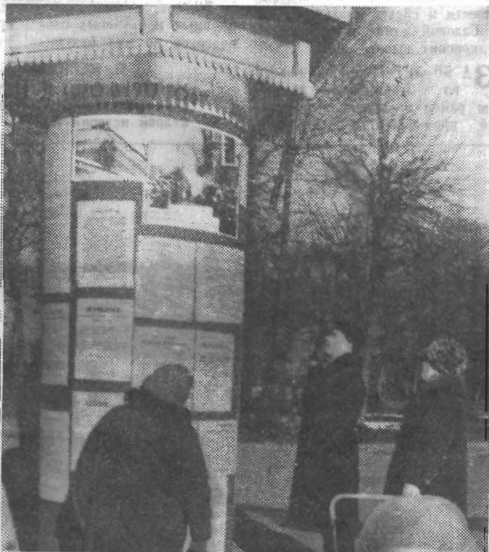
Еще весной на улицах нашего города появились необычные тумбы для расклейки афиш, точно такие, какие можно было увидеть на петроградских улицах 50 лет назад, в революционные дни 1917 года. Возвзвания, прокламации, призывы, обращения — все это воссоздает атмосферу той героической эпохи.