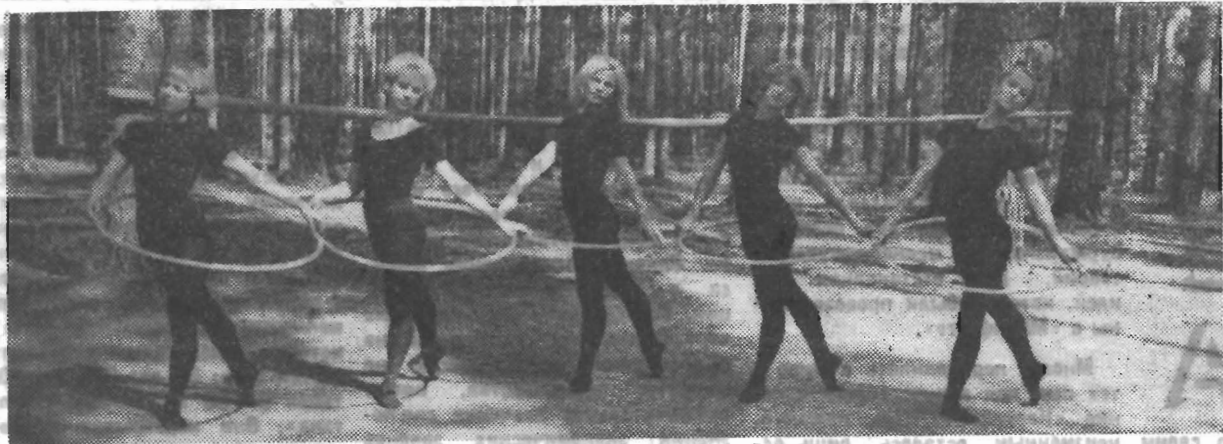
Институтская секция художественной гимнастики — одна из самых «сильных». В ее рядах два мастера спорта и немало спортсменов-разрядников. Нынешним летом наши гимнастки много и упорно тренировались в спортивно-оздоровительном лагере ЛИТМО в Ягломом.