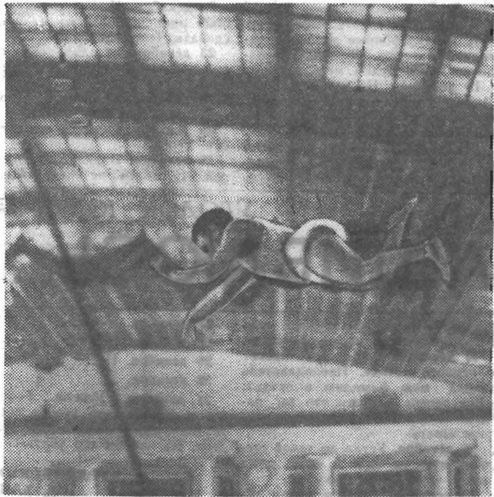
Состязания по прыжкам с шестом на городских студенческих соревнованиях, посвященных 50-летию Октября.

Приятно и то, что наиболее дружные и громкие крики одобрения звучали с трибун, где сидели болельщики нашего института. Их от соревнования и соревнования становится все больше и больше! З. АМБАРОВ, старший преподаватель