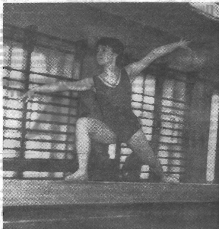
Стройную осанку, ловкость, изящество движений — все это можно приобрести, записавшись в секцию спортивной гимнастики нашего спортклуба, где занятия со студентами ведут опытные, квалифицированные тренеры.

В целом можно отметить повышение класса футболистов института. Интерес к первенству вузов был большим, ибо наша команда — лидер своей группы. Вторая команда ЛИТМО, хотя и улучшила игру, но к нашему великому огорчению, выигрывать еще не научилась. За сезон команда провела семь встреч, из них 2 выиграла, 4 сыграла вничью и две проиграла. Соотношение мячей 9:9. В. ГОЛУБЕНКО, тренер футбольной секции