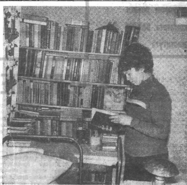
За годы учебы многие студенты собирают неплохие личные библиотеки. Полки с книгами — первое, что бросается в глаза, когдаходишь во многие комнаты нашего общенития.