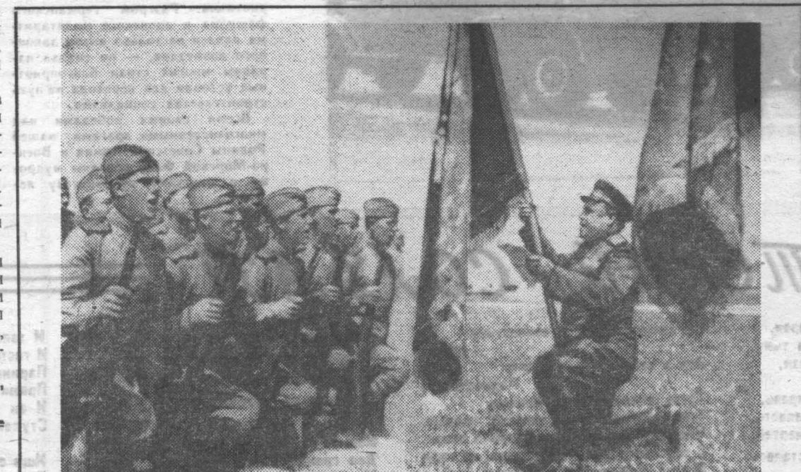
Среди славных воинских традиций, которые прочно живут в нашей армии, эта, безусловно, самая волнующая. Клятву на верность Отчизне давали те, кто отстаивал свободу на фронтах Отечественной войны.