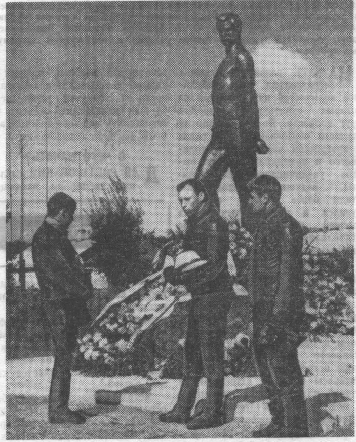
Мотоспортсмены ЛИТМО на открытии памятника Сергею Тюленину на родине героя-молодогвардейца в деревне Нечаево Орловской области.

Традиции, порожденные великими общественными преобразованиями, составляют огромную духовную ценность народа и являются мощным средством воздействия на эмоции человека, на