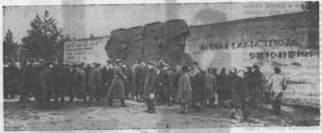
Открытие памятника защитникам Ленинграда у деревни Керново.

РЯДОМ с монументальными памятниками-ансамблями в разных местах нашей страны стоят сотни обыкновенных скромных памятников, обелисков, которые повествуют о славных делах старших поколений, о героических подвигах защитников Родины. На полях минувших сражений появляются все новые и новые памятники погибшим героям. Монумент героическим защитникам Ленинграда в годы Великой Отечественной войны сооружен в прошлом году трудящимися