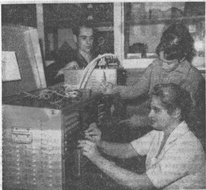
Студенты группы 61 на занятиях в лаборатории автоматического регулирования и управления кафедры автоматики и телемеханики.