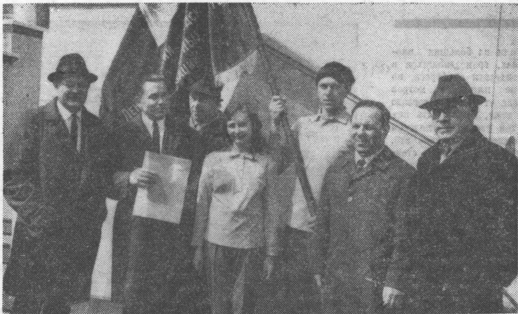
На Дворцовой площади. Представители кафедры физвоспитания и спортклуба ЛИТМО — у переходящего Красного знамени.