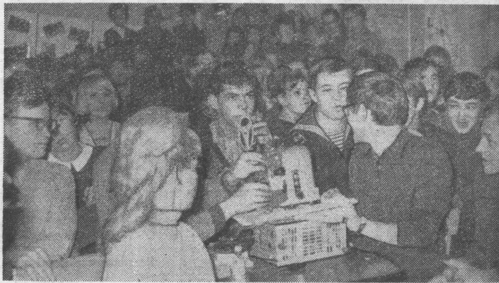
НА ИНСТИТУТСКОМ ТУРИСТСКОМ ВЕЩЕРЕ.