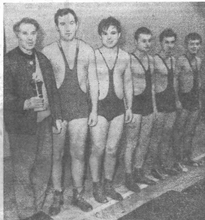
Команда борцов оптического факультета — победитель соревнований на кубок газеты «Кадры приборостроению».