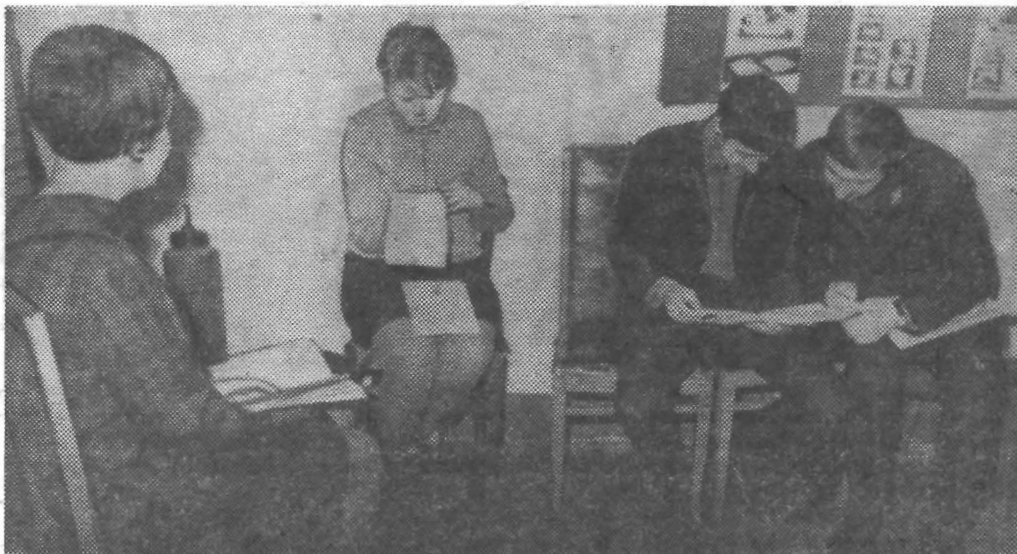
Экзаменационные будни. Первокурсники в ожидании своей «участи».