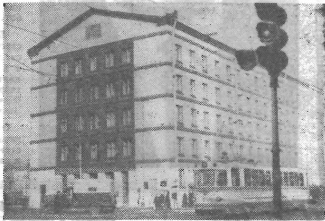
На снимке: один из новых домов в Октябрьском районе.

жилфонда, более 11 млн. руб. на капитальный ремонт домов, около 5 млн. руб. на текущий ремонт и внешнее благоустройство. Работы по благоустройству проводились в течение всего периода с учетом современных требований и эстетики производства. Посажено 1656 деревьев, 43 тыс. кустов и 474 тыс. цветов. В целях благоустройства дворовых территорий было снесено 2476 заборов, сараев, старых строений. Заасфальтировано 82,9 тыс. кв. м дворовой площади, построено вновь 39 спортивных и детских игровых площадок.