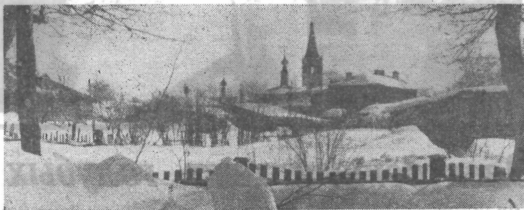
По древнерусским городам. Суздаль.