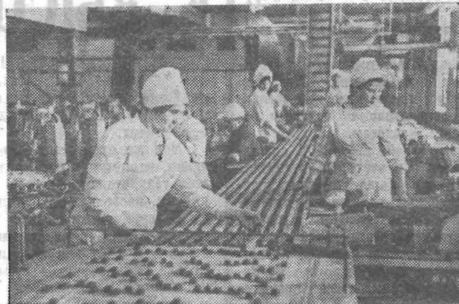
Конвейер шоколадных конфет

факт, что многие предприятия уже работают в условиях новой системы планирования и экономического стимулирования. В настоящее время в районе из 22 перешедших на новые методы хозяйствования предприятий все успешно справляются с выполнением важнейших технико-экономических показателей. 109 ос-