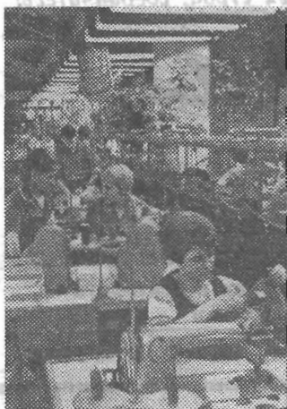
Лучший участок объединения им. Володарского.

Ч ТОБЫ обеспечить высокие темпы роста производительности труда (не менее 7 процентов ежегодно), надо непрерывно совершенствовать техническое оснащение предприятия, технологию производства, улучшать организацию труда и управления, повышать культурно-технический уро-