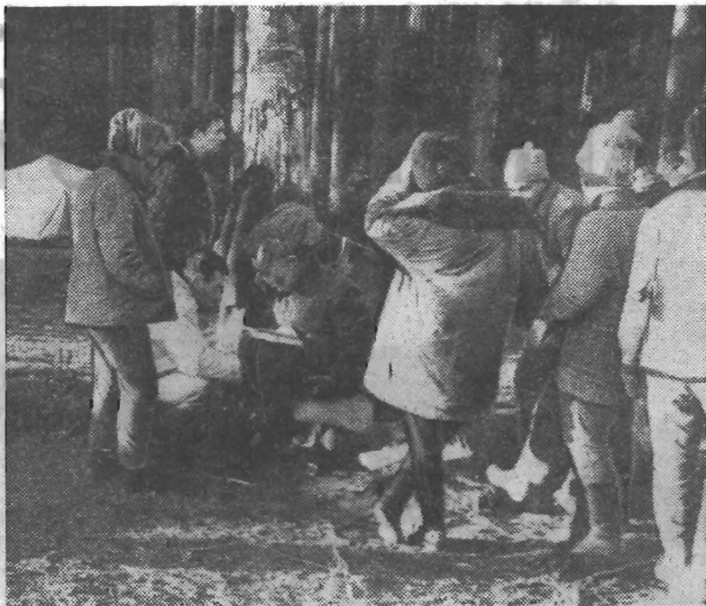
Фото студента 435-й группы Геннадия Капустина