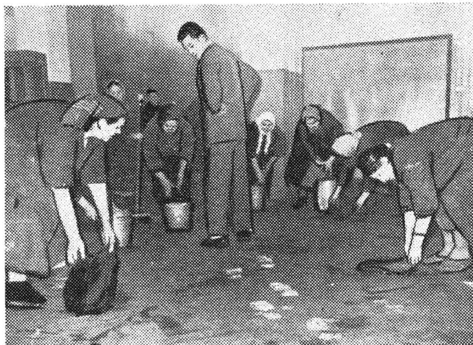
Фото Б. Смирнова, текст М. Побединского

Порою фотообвинение О многом может рассказать. О скромности и самомнении, О тех, кто трудится, и тех, кому на труд их наплевать.