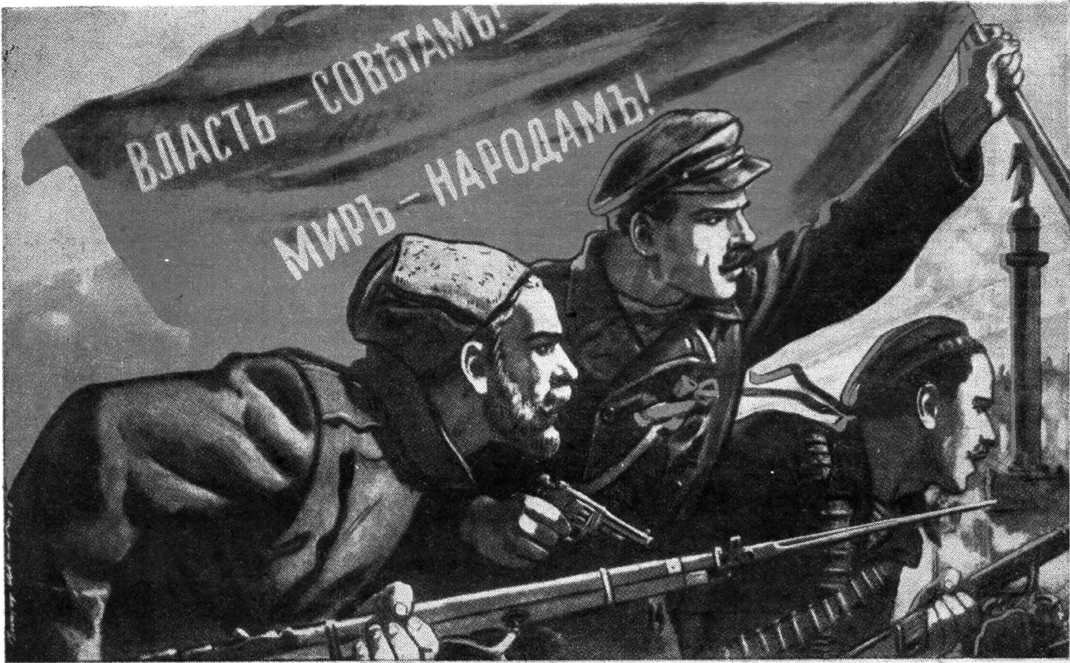
ЗАЛП «АВРОРЫ» ВОЗВЕСТИЛ РОЖДЕНИЕ НОВОЙ ЭРЫ

Орган партбюро, комитета ВЛКСМ, профкома, месткома и дирекции Ленинградского института точной механики и оптики