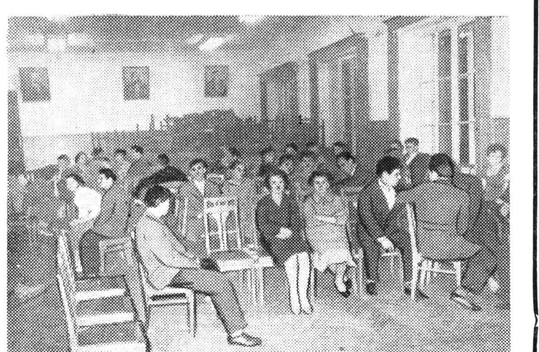
Фото и текст Б. Смирнова, ст. лаборанта кафедры физики.

А это аудитория № 404. Она хоть и недалеко от той, где играют в «хоккей», но, как видите, здесь обстановка не очень-то располагает к отдыху — здесь скучно... А скуче не место на наших вечерах!