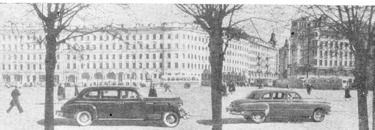
Так выглядит площадь Мира (бывш. Сенная площадь) теперь.