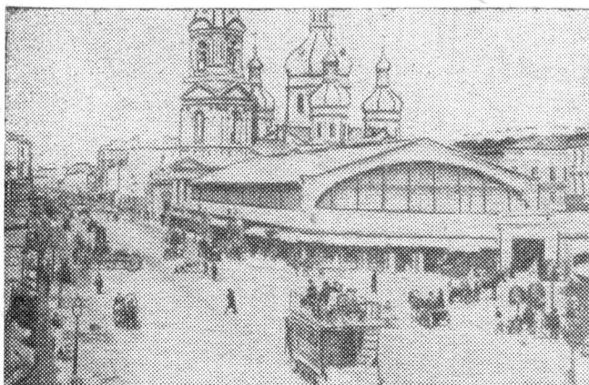
Так выглядела Сенная площадь до Великого Октября.