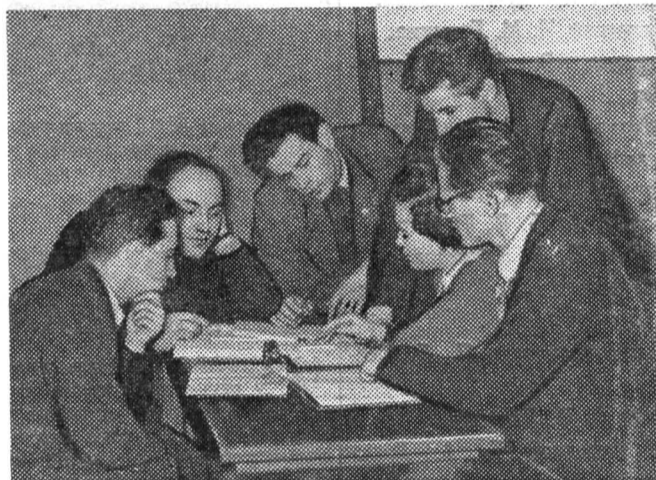
Через полчаса экзамен у студентов 520-й группы... Полезно посоветоваться, обменяться мнениями с друзьями перед экзаменом.