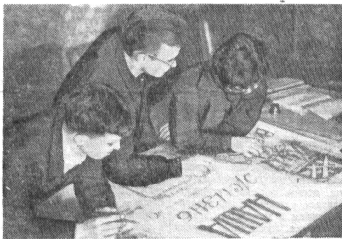
В одной из комнат нашего общежития студенты готовят к выпуску стенную газету.

М. ЛИХТЦИНДЕР, руководитель кружка цветной фотографии