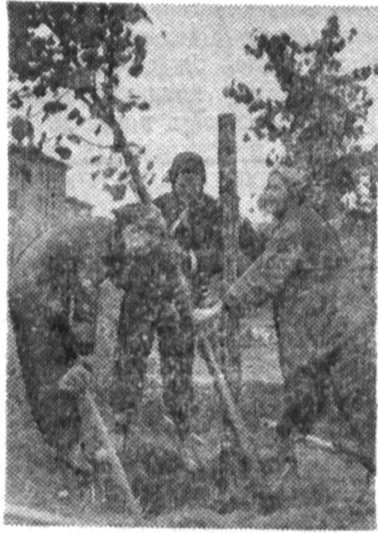
В зеленый наряд одевается спортплощадка института. На снимке: студенты сажают деревья.