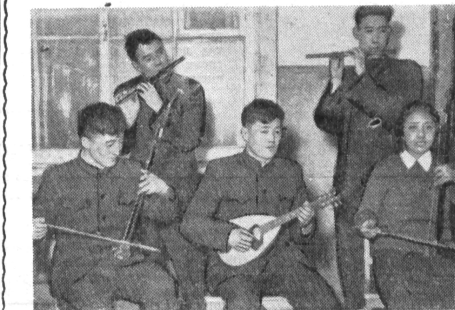
Эти студенты в свободное время с увлечением играют на народных инструментах.