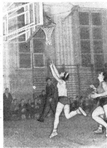
НА СНИМКЕ: момент игры женской команды.

Первого декабря состоялась одна из решающих встреч на первенство вузов по баскетболу. Команды нашего института встретились со спортсменами ЛЭТИ. Отлично провели игры женские команды, менее удачно выступили мужчины. Общий результат встречи — ничья.