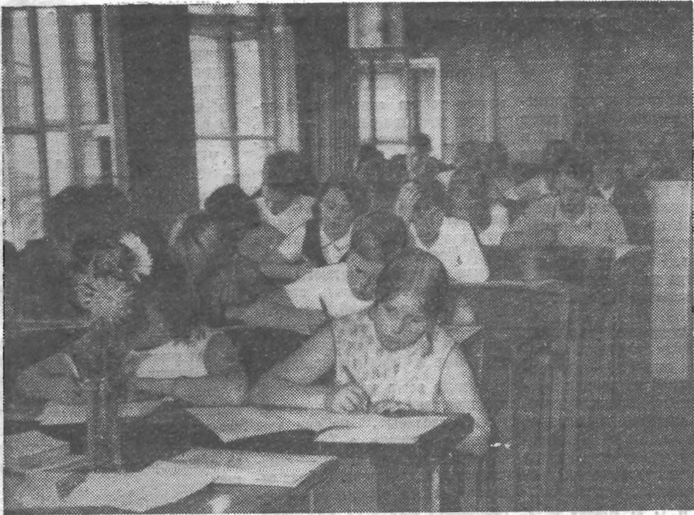
Письменная работа по математике на приемных экзаменах оказалась для многих решающим испытанием. Перед тем, кто его выдержал, открылась дорога в вуз.