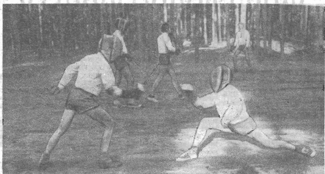
Нынешнее лето выдалось на редкость удачным. И вдвойне привлекательным было оно для тех, кто провел его в спортивно-оздоровительном лагере института в Ягодном.

Волховский район («Смена» на студенческой стройке)