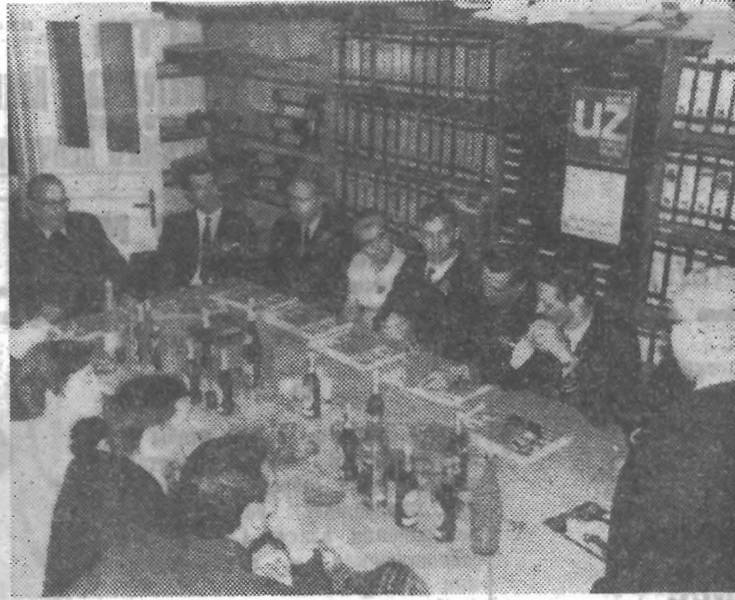
На снимках: встреча ленинградской делегации с коллективом редакции газеты Германской коммунистической партии «Унзере цайт»; торговый центр Гамбурга.