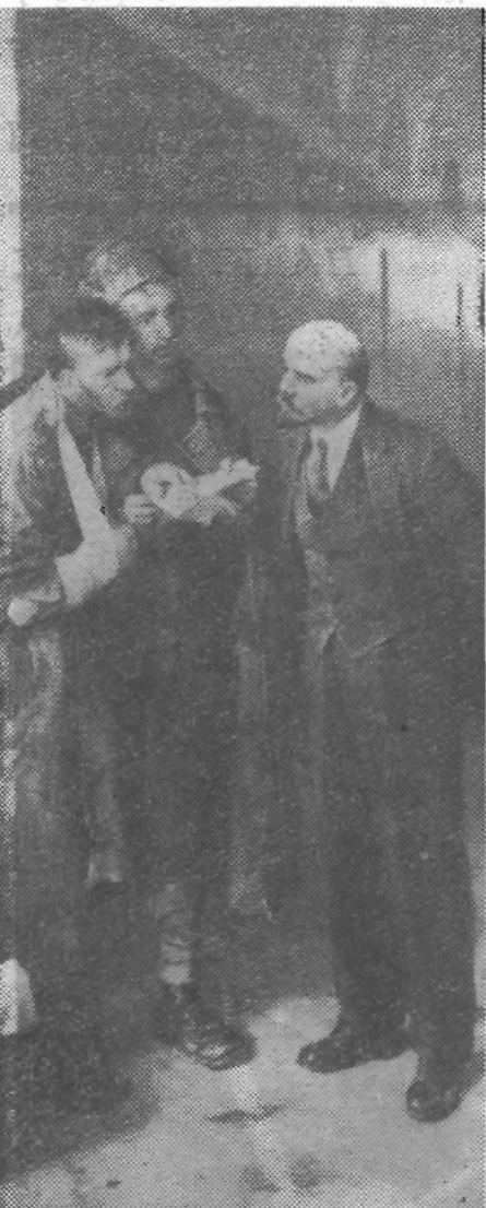
«Вести из деревни».